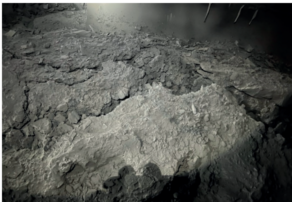
Рис. 2. Пример трещин в почве в вентиляционном штреке 214-с (20.05.2025) [создан авторами] Fig. 2. Example of cracks in the soil in the ventilation shaft 214-с (05/20/2025) [created by the authors]

В условиях действующих шахт, обрабатывающих удароопасные угольные