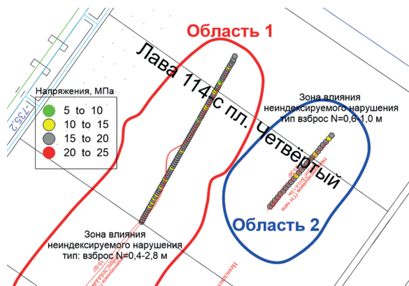
Рис. 3. Напряжения на 6-м метре в зонах геологических нарушений (в МПа) [создан авторами]

В техногенных массивах значение опорного давления, при всем многообразии проявлений горного давления, играет важную роль [27, 28]. При исследовании зоны опорного давления внимание должно быть обращено на определение