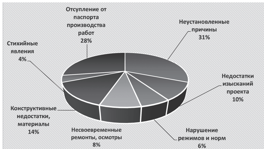
Рис. 1. Диаграмма аварий в подземном строительстве

На рис. 1 представлена диаграмма аварий при подземном строительстве [6],