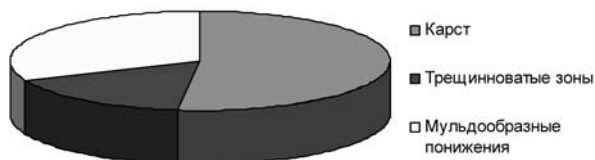
Рис. 2. Распределение прогнозных аномальных зон по типам нарушений

электрметрии (НСЭМ) и подземно-скважинной электрметрии (ПСЭМ) на 22 выемочных столбах шахт бассейна с общим числом физических точек измерений 17 380 [12]. Согласно данным по результатам опытно-промышленного внедрения методики интерпретации электрметрических данных, были выявлены 54 прогнозные аномальные зоны; из них 28 нарушений типа карстовых и эрозионных, 9 – трещиноватых зон и 17 – мульдообразных понижений и литифицированных пород, также способствующих прорывам воды в горные выработки. Однако подтверждение бурением и проходкой получили толь-