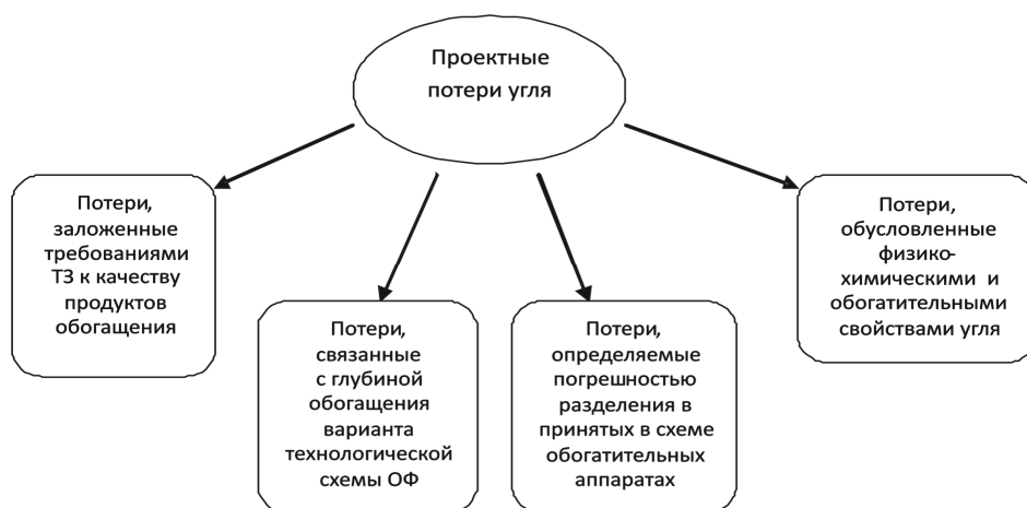
Рис. 1. Состав проектных потерь

максимальной прибыли предприятием. Таким образом, целесообразность принятия прямых потерь, связанных с глубиной обогащения, определяются прибыльностью проекта. Прибыль от переработки шлама и реализации концентрата в схеме с обогащением до «нуля», с применением дорогостоящего процесса флотации угля, будет зависеть от затрат на строительство флотационного отделения, строительство сушильного отделения, и вытекающих отсюда эксплуатационных затрат, в том числе на флотореагенты, на обезвоживание и сушку флотоконцентрата. Обычно, для схем обогащения коксующихся углей, благодаря высокой цене на концентраты, применяют схемы с обогащением до «нуля», т.е. с включением в схему ОФ процесса флотации.